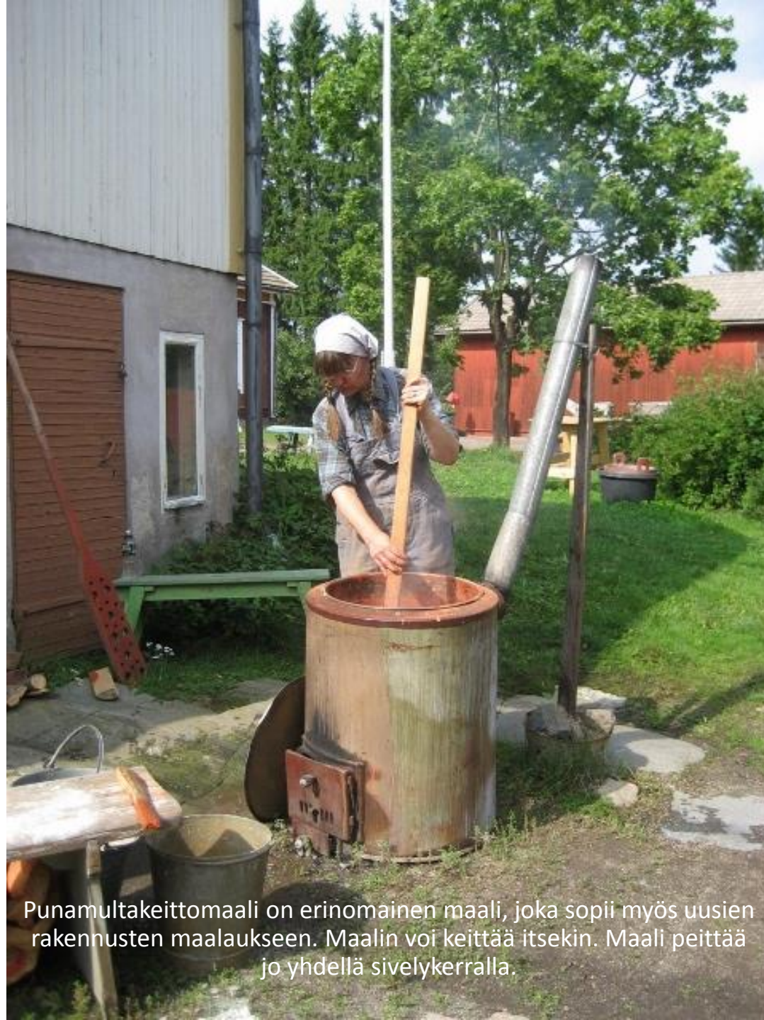
Punamultakeittomaali on erinomainen maali, joka sopii myös uusien rakennusten maalaukseen. Maalin voi keittää itsekkin. Maali peittää jo yhdellä sivelykerralla.